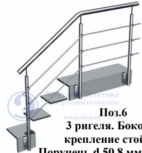
Поз.6 3 ригеля. Боковое крепление стойки. Поручень d 50,8 мм. Ригель-d 16 мм. 4950 руб./м.п.

Ограждающие конструкции с заполнением из стекла. Также возможны варианты из квадратной и профильной нержавеющей трубы марки AISI 304, AISI 201, AISI 430