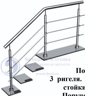
Поз. 4 3 ригеля. Крепление стойки в пол. Поручень d 50,8 мм. Ригель d 16 мм. 5200 руб./м.п.

Лестничные ограждения с держателями ригеля (бочонках).