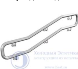
Поз. 10 Поручень сдвоенный. от 3700 руб./м.п.