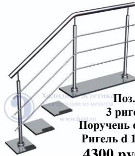
Поз. 2. 3 ригеля. Поручень d 50,8 мм. Ригель d 16 мм. 4300 руб./м.п.