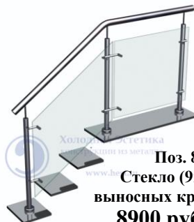
Поз. 8 Стекло (9мм) на выносных кронштейнах 8900 руб./м.п.