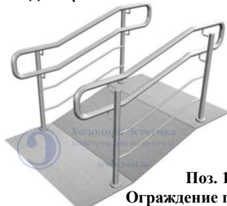
Поз. 11 Ограждение пандуса от 4500 руб./м.п. Пандус