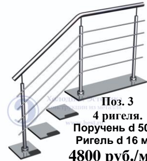
Поз. 3 4 ригеля. Поручень d 50,8 мм. Ригель d 16 мм. 4800 руб./м.п.

Лестничные ограждения с держателями ригеля (бочонках).