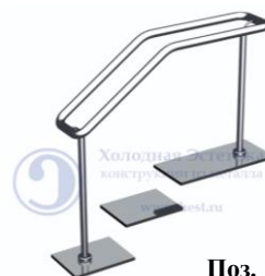
Поз. 12 Разделитель потоков. от 3000 руб./м.п.