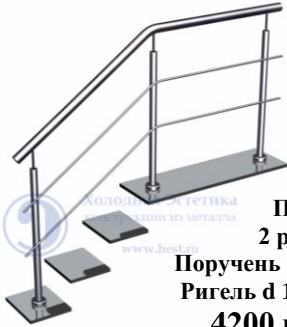
Поз.1 2 ригеля. Поручень d 50,8 мм Ригель d 16 мм. 4200 руб./м.п.

Лестничные ограждения с ригелями, установленными на аргонно-дуговой сварке.