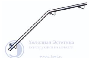
Поз. 13 Поручень пристенный от 1950 руб./м.п.