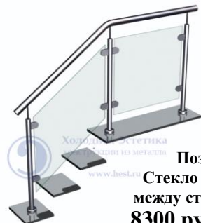
Поз. 7 Стекло (9 мм) между стойками 8300 руб./м.п.

Ограждающие конструкции с заполнением из стекла. Также возможны варианты из квадратной и профильной нержавеющей трубы марки AISI 304, AISI 201, AISI 430